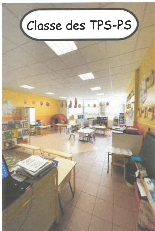
Classe des TPS-PS