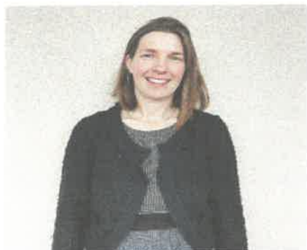
Nausicaa, la directrice